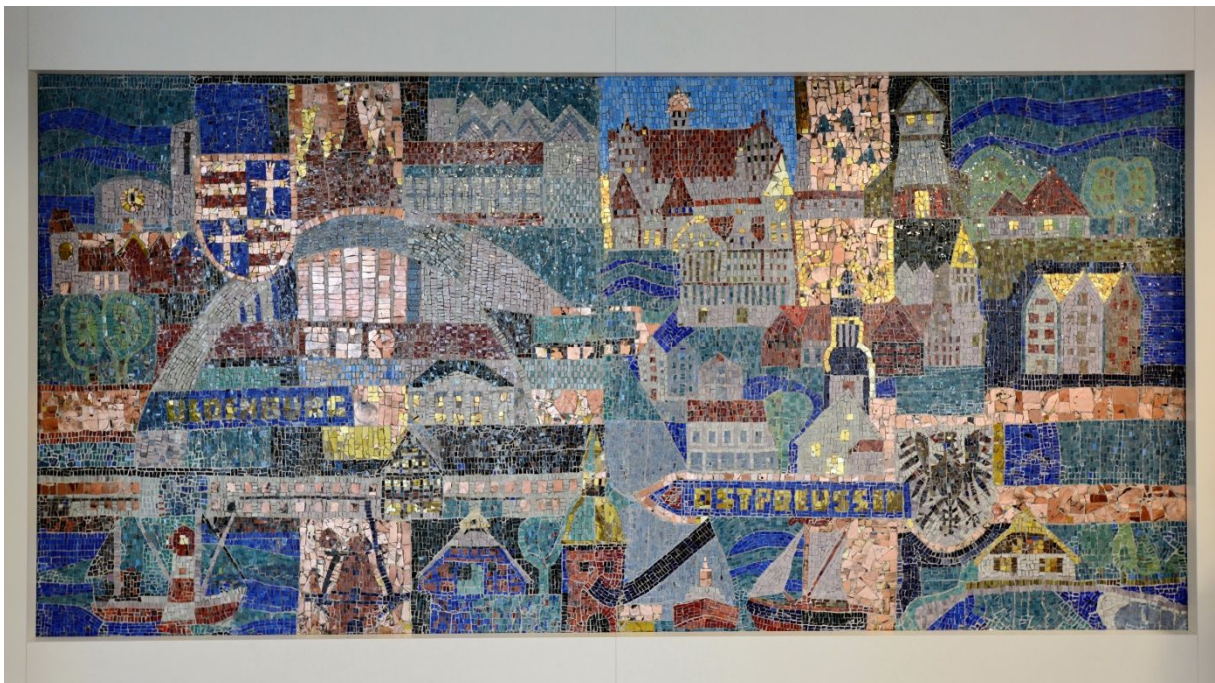
Georg Schmidt-Westerstede: Glasmosaik "Von Ostpreußen ins Oldenburger Land", 1970. Seit 2016 im Foyer des Hansa-Pflegezentrums. Ursprünglich im Großmarkt der Adolf Meins KG, Metjendorf. 205 x 420 cm