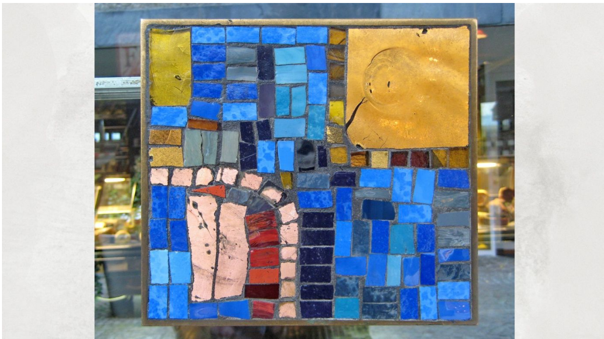
Georg Schmidt-Westerstede: Türgriff mit Glasmosaik-Auflagen, eingefasst in Goldbronze. 20 x 18 cm