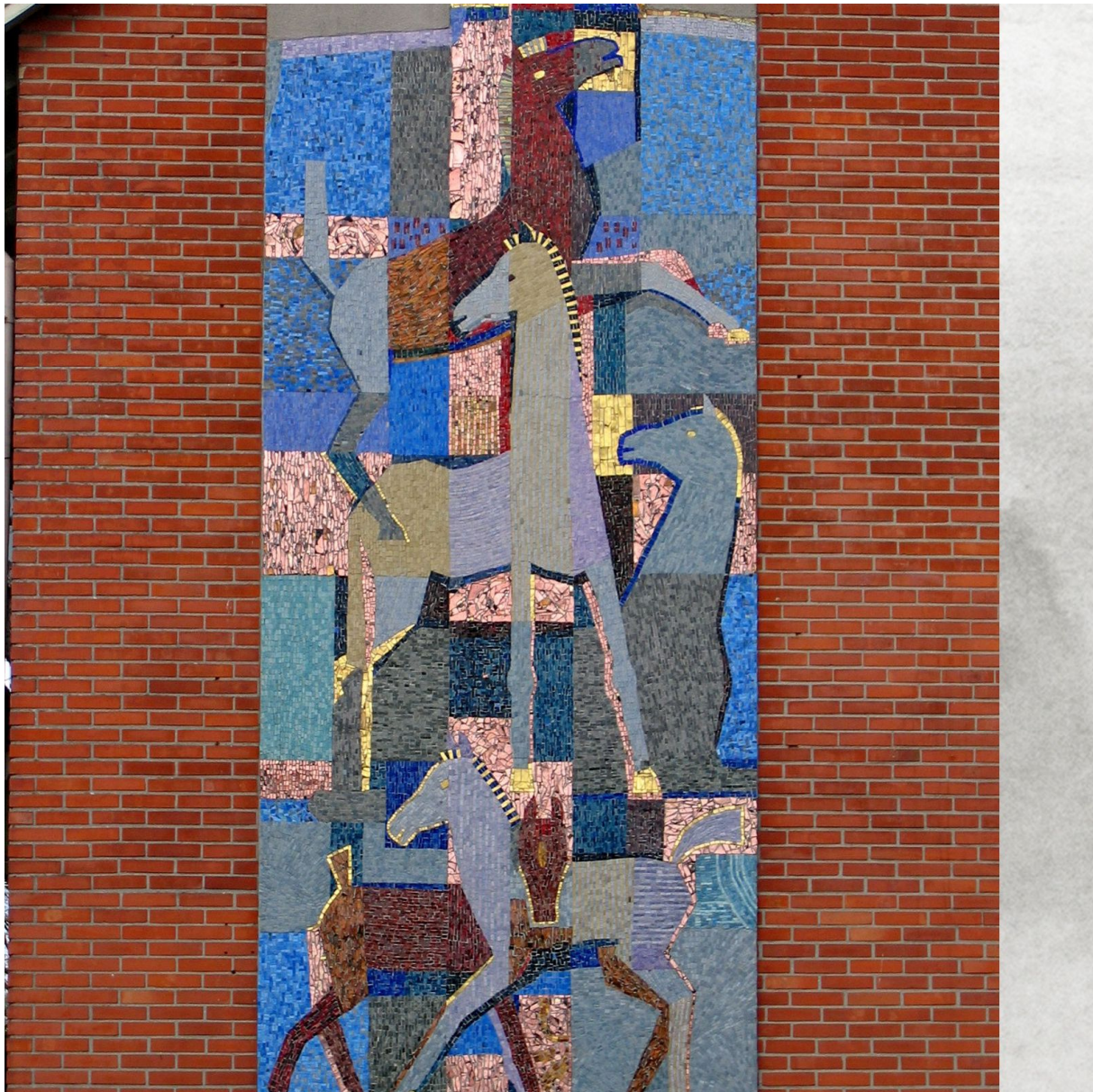
Georg Schmidt-Westerstede: Glasmosaik, Pferde, 1965. Mehrfamilienwohnhaus der Ammerländer Wohnungsbau. 2008 zerstört, Rekonstruktion und Neuinstallation 2010 am Amtsgericht Westerstede.

Die Audioreportage ist noch bis zum 27.04.2022 zu hören unter https://www.bremenzwei.de/audios/kunst-schmidt-westerstede-100.html