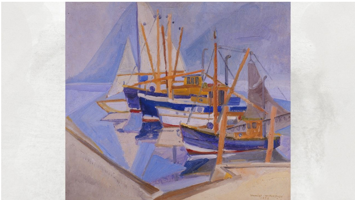
Georg Schmidt-Westerstede: Fischkutter und Boote im Hafen, 1953. Öl auf Hartfaser, ca. 69,8 x 80 cm