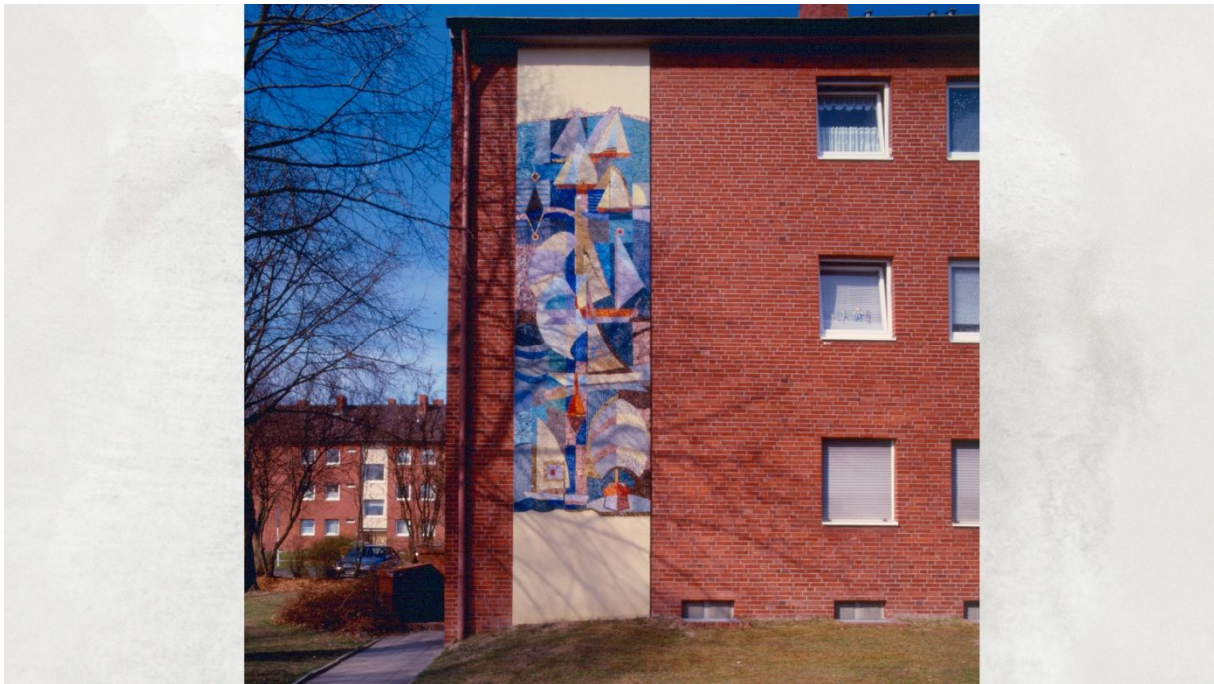
Georg Schmidt-Westerstede: Glasmosaik "Segeln", 1964. An der Seitenfassade eines Mehrfamilienwohnhauses, Wilhelmshaven. 600 x 200 cm