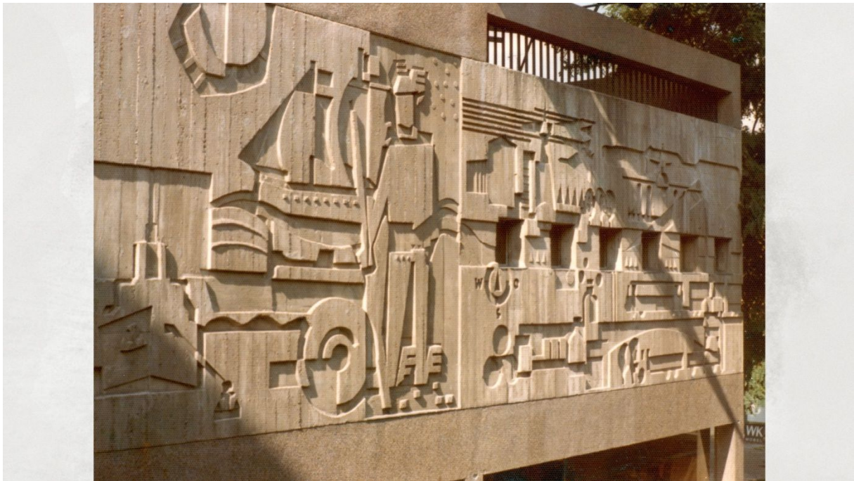
Georg Schmidt-Westerstede: Relief aus Beton, Merkur, 1965, Alter und neuer Handel. An der Fassade (OG) eines Geschäftshauses. 340 x 1105 cm